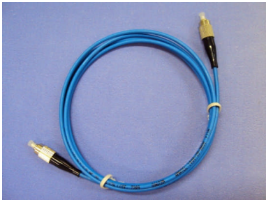
- sem escala - Figura ilustrativa